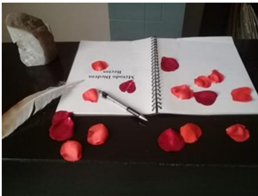
La pluma que me inspiró, para escribir esta bella obra.

Cuando terminé de escribir la obra, me imaginé en un escenario pensando quiénes podían representar cada personaje. Pero tenían que haber dejado una huella muy profunda en mi vida para invitarles a ser parte de este libro, y me encuentro con la grata sorpresa que quedaron fascinados con la dedicatoria de los personajes, y ellos me enviaron su expresión de la misma regalándome un derroche de bellos sentimientos en cada estrofa.